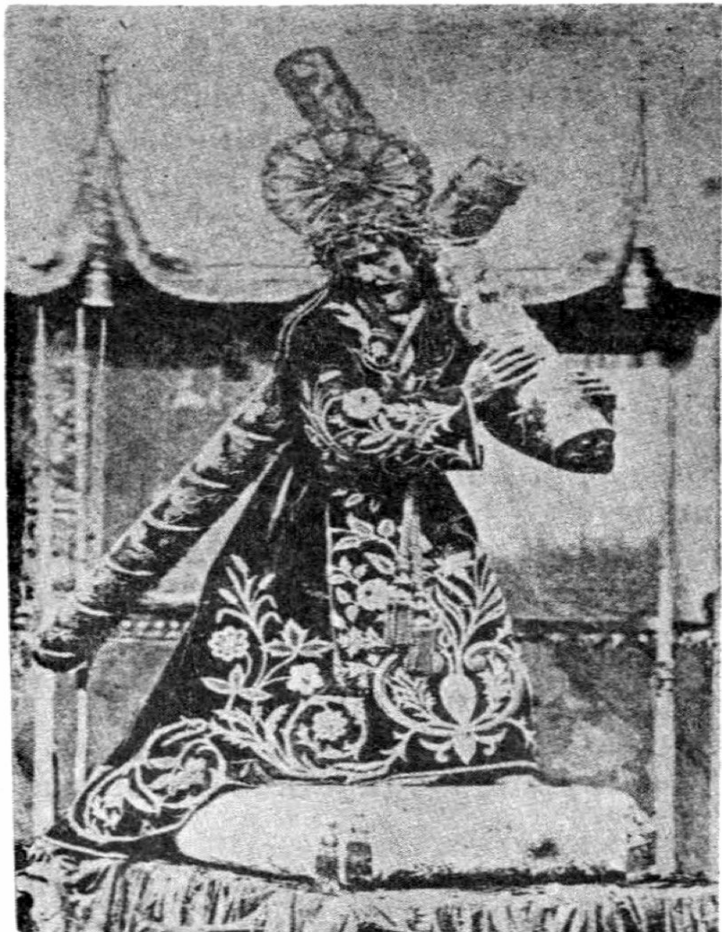
Consagrada y Milagrosa Imagen de JESUS NAZARENO DE LA MERCED