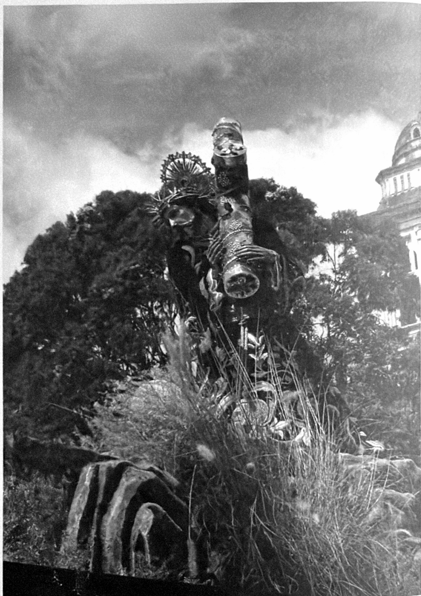
Jesús Nazareno de La Merced. Guatemala Detalle del adorno de andas. Viernes Santo 2,007