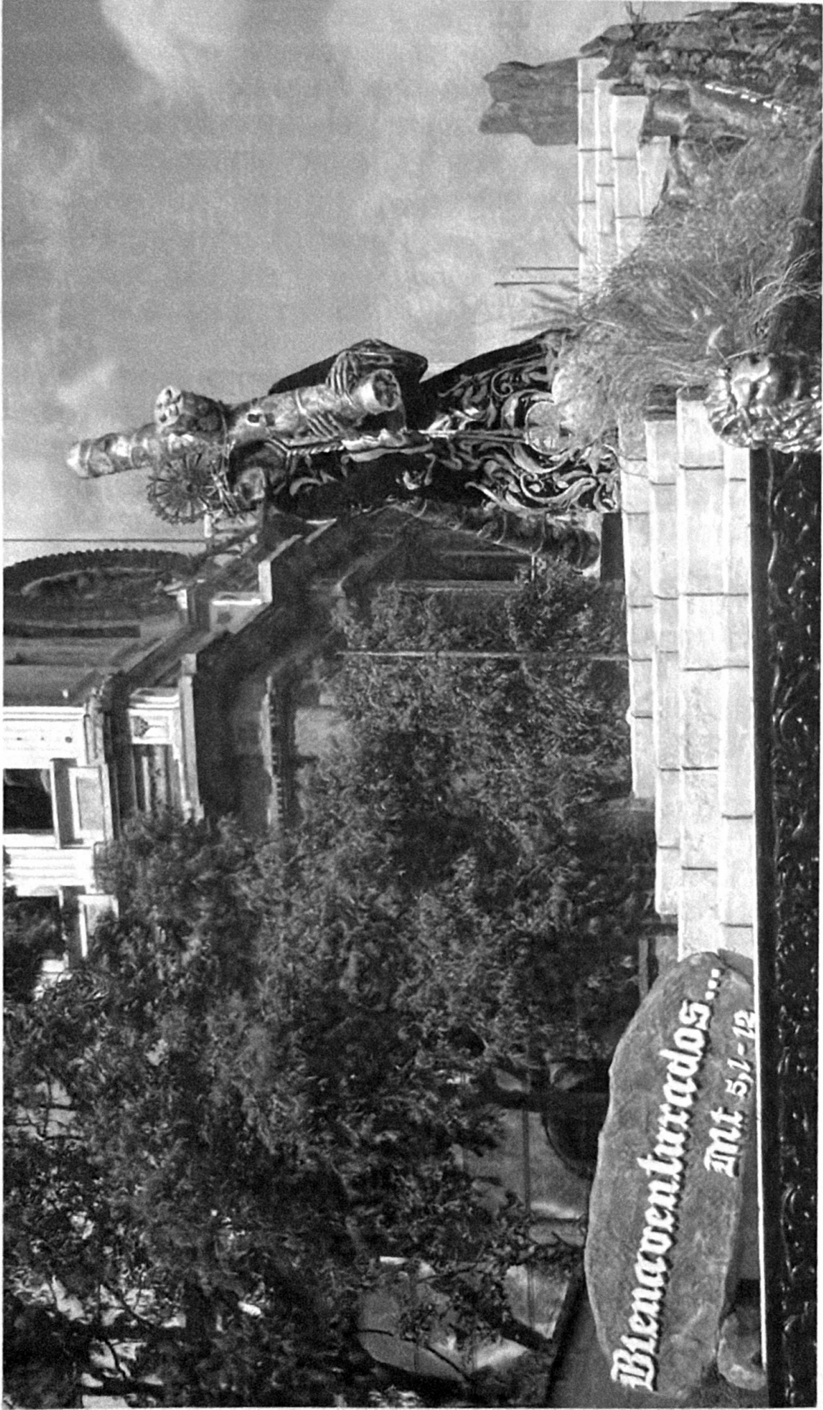
Viernes Santo 6 de abril 2,007. Andas de Jesús de La Merced. Entre piedras y vegetación, el mensaje: Las Bienaventuranzas. Mt. 5, 1-12