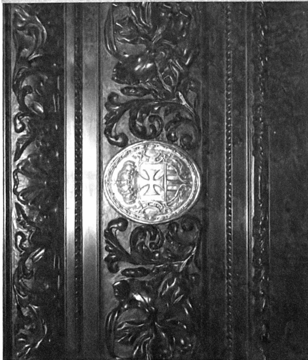
Andas de Jesús. Vista de la talla en madera y escudo frontal.