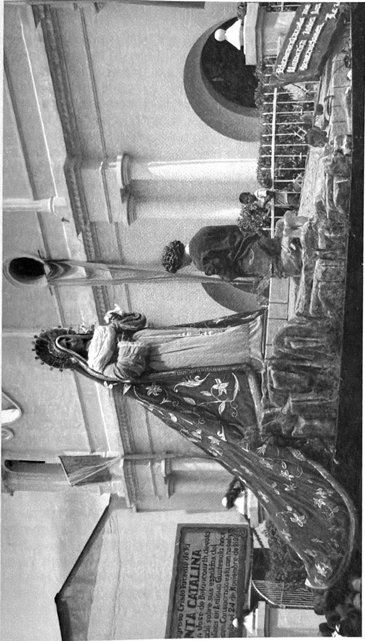
Viernes Santo 6 de abril 2,007. Alegoría de las andas de la Virgen de Dolores: "Bienaventurada me llamarán todas las generaciones" Lc. 1, 48