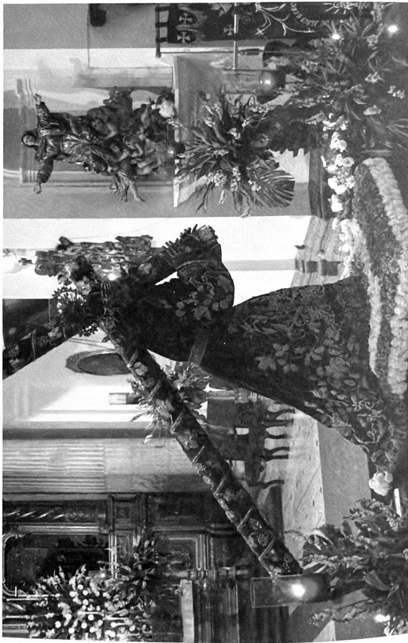
Velación del 5 de agosto del 2,007. 290 años de la consagración de Jesús Nazareno de La Merced.