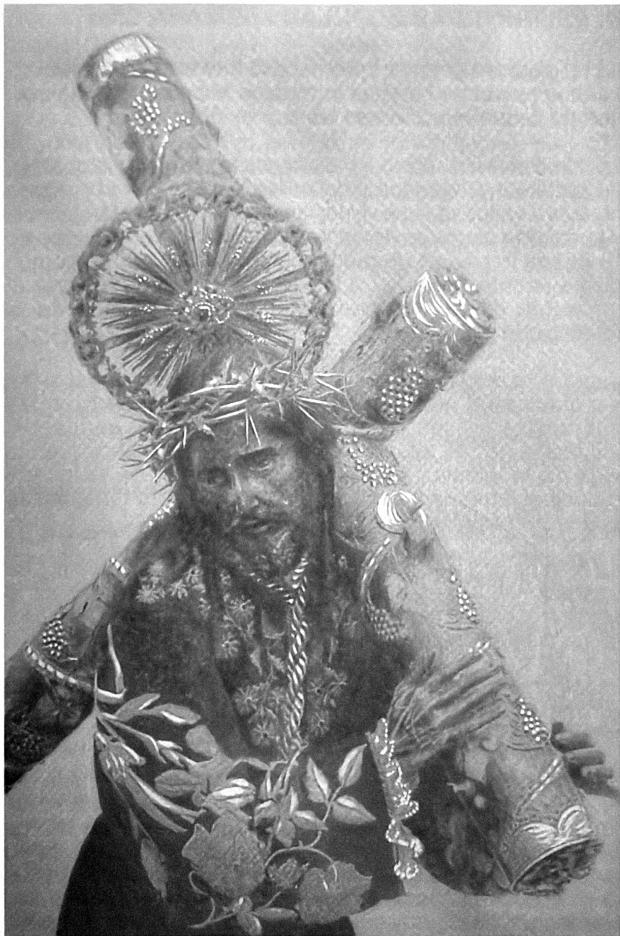
Fotografía de las primeras décadas del siglo XX.