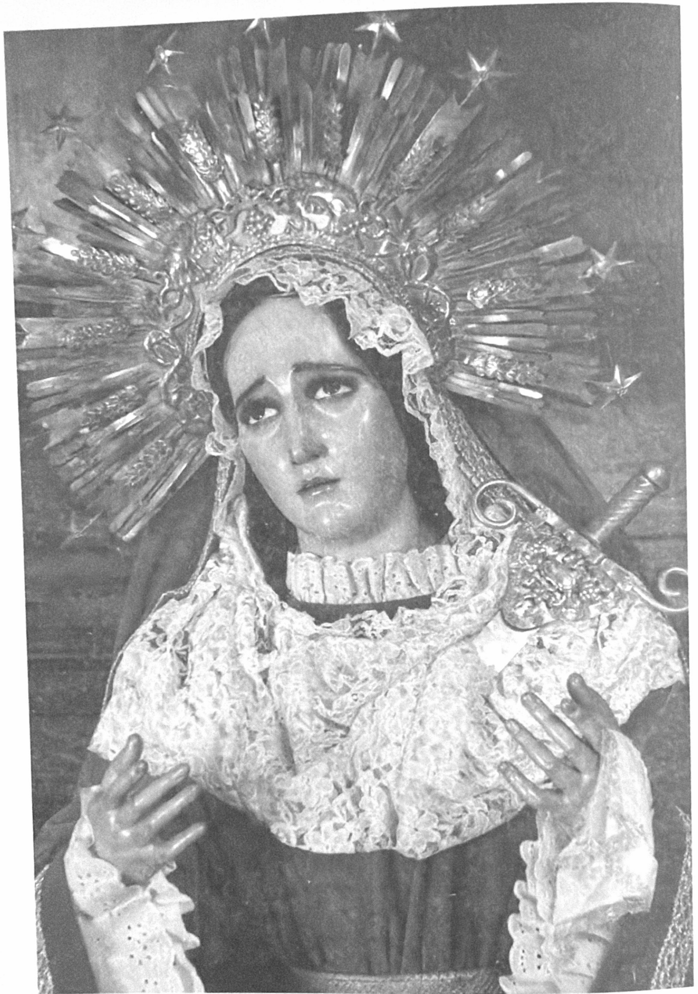
Santísima Virgen de Dolores de La Merced. Guatemala