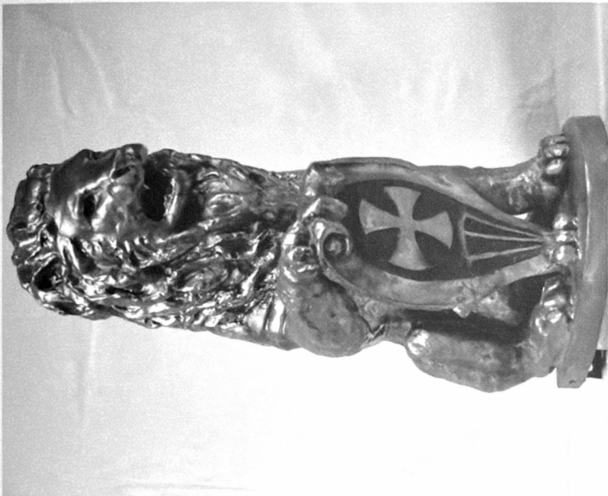
León esquinero de las andas de Jesús