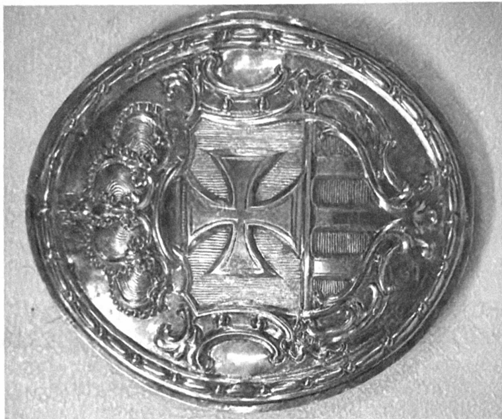
Escudo Mercedario. Uno en cada costado de las andas de Jesús.