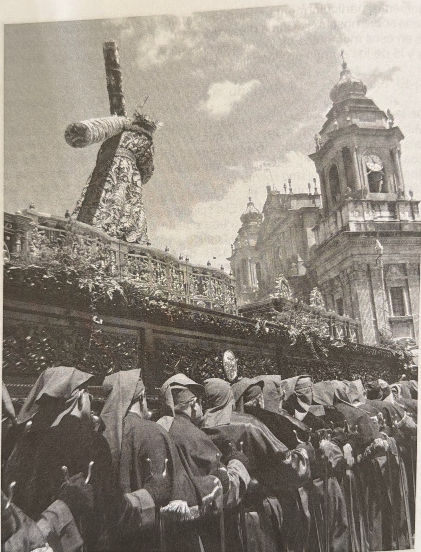
Viernes Santo del 2008. Acercándose a Catedral al medio día, Jesús de La Merced llega al encuentro con sus devotos