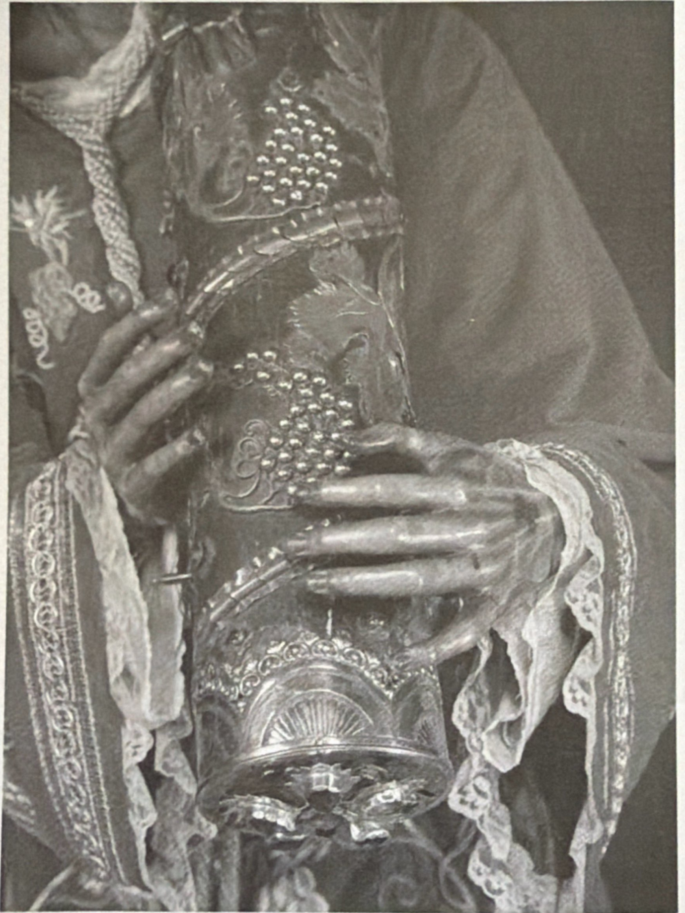
Las manos de Jesús de la Merced, Patrón Jurado de la Ciudad