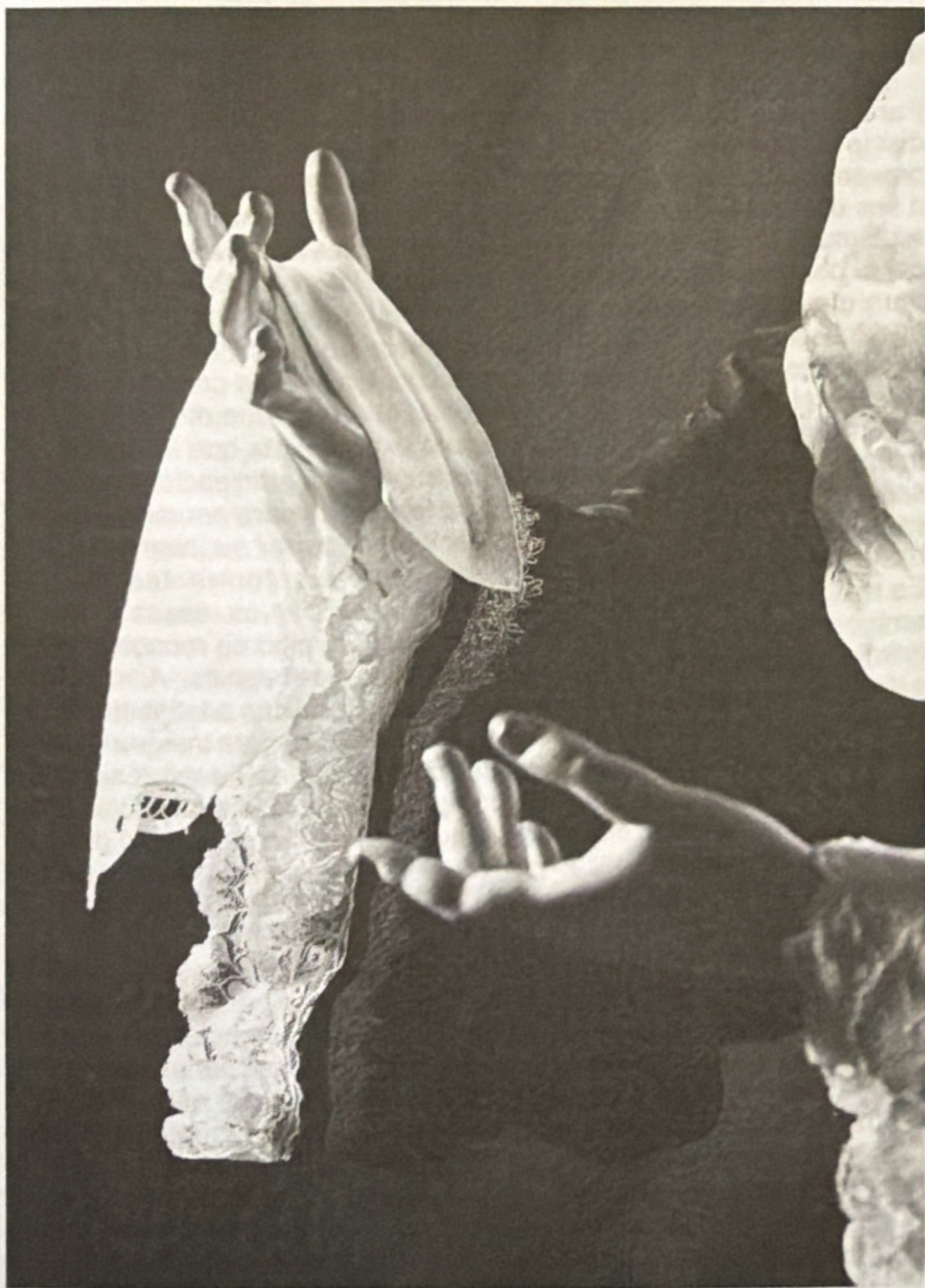
Las manos de la Dolorosa de La Merced