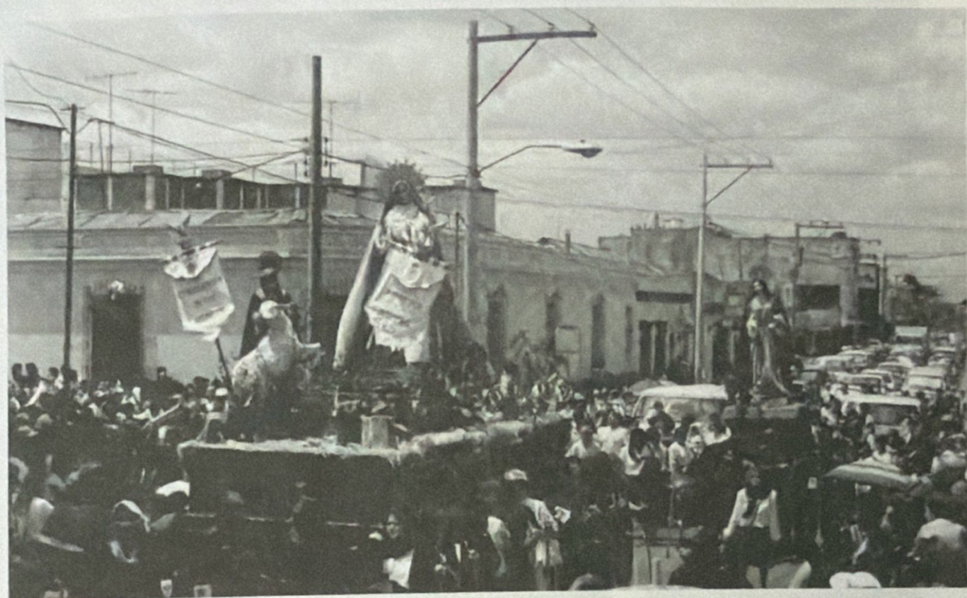
VIERNES SANTO, 14 DE ABRIL DE 1995