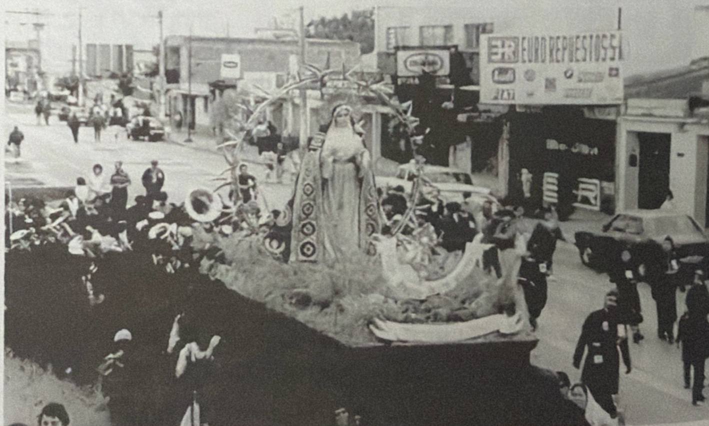
VIERNES SANTO, 1 DE ABRIL DE 1994