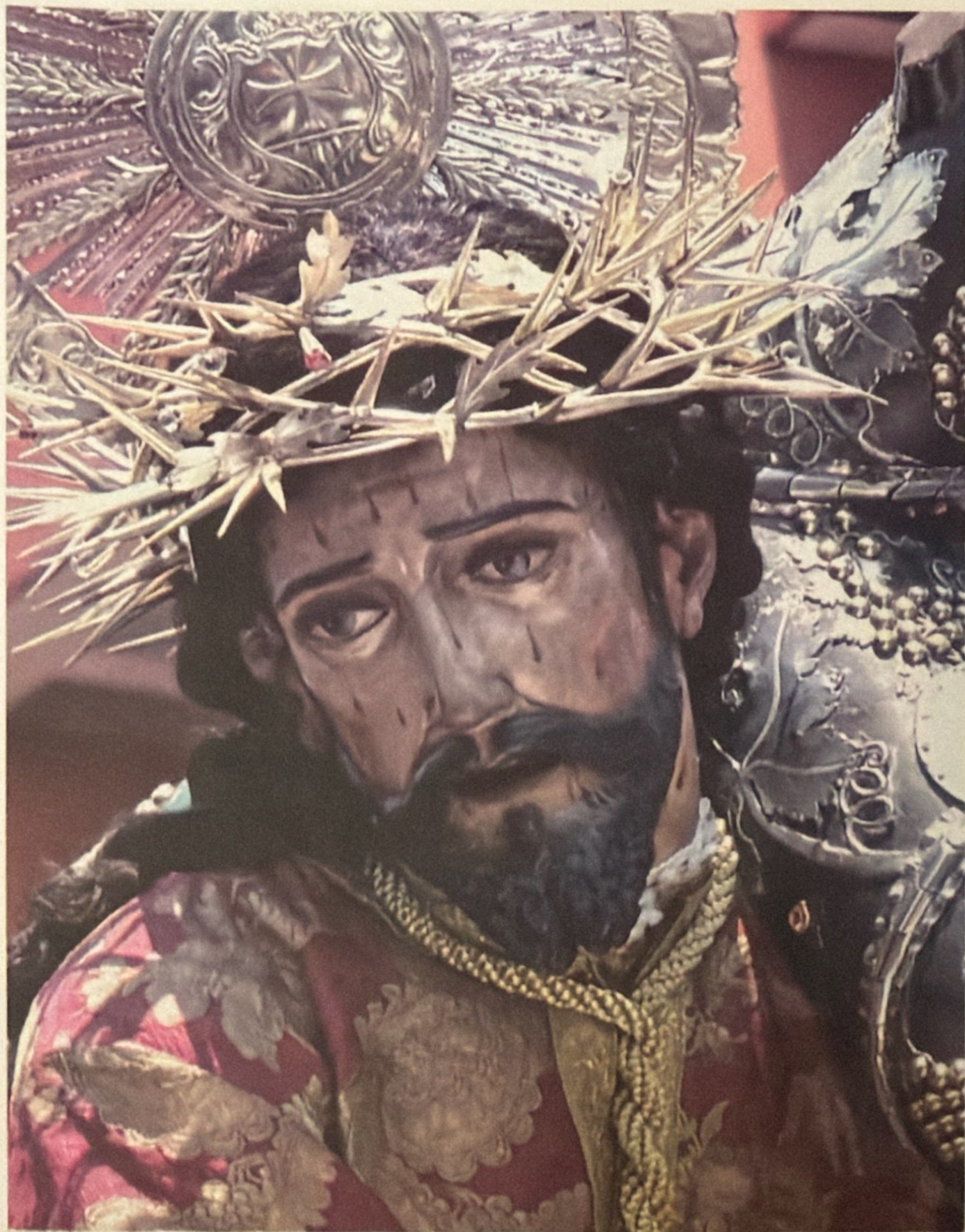
CONSAGRADA IMAGEN DE JESUS NAZARENO DE LA MERCED