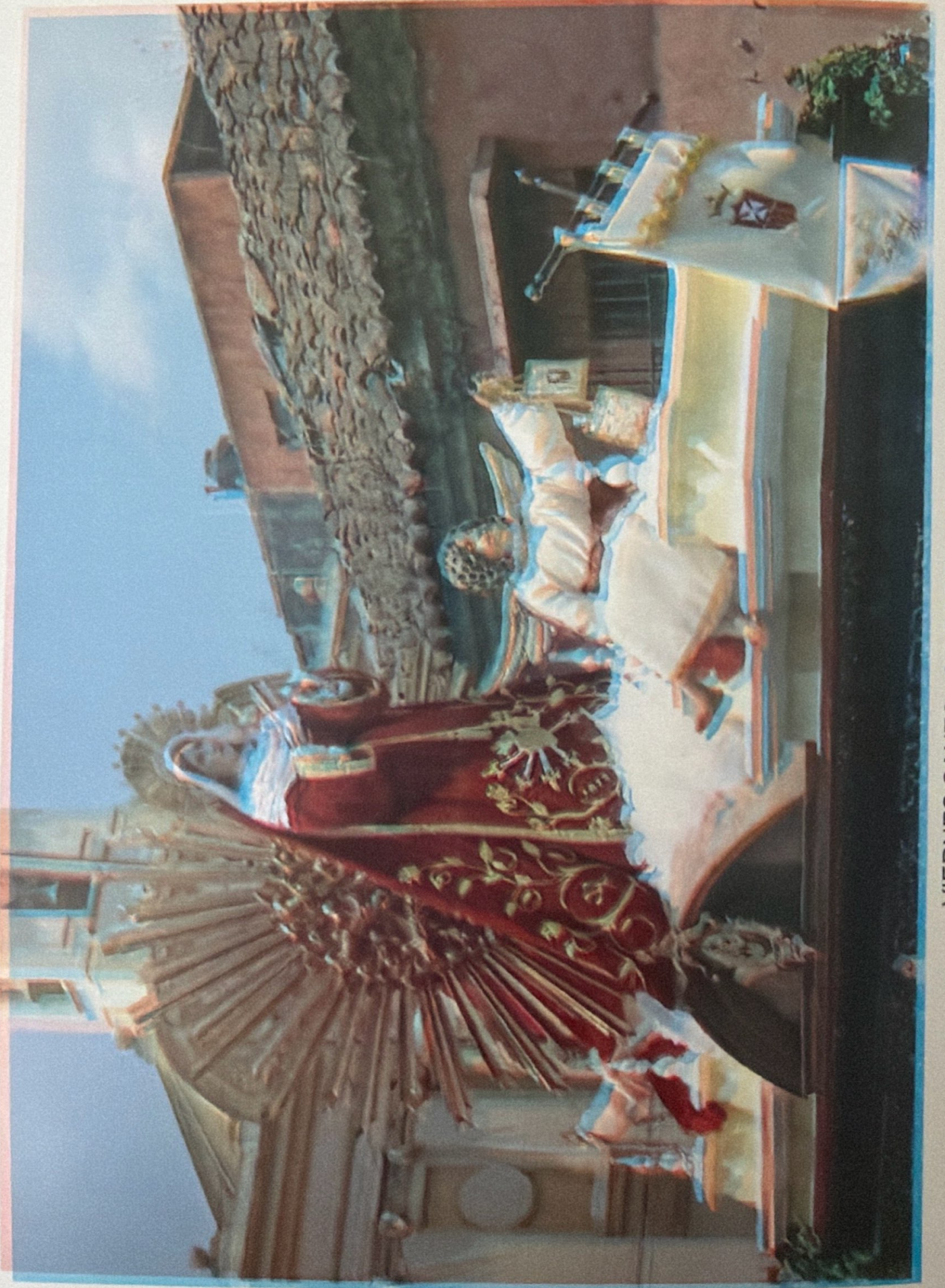
VIERNES SANTO, 6 DE ABRIL DE 2012