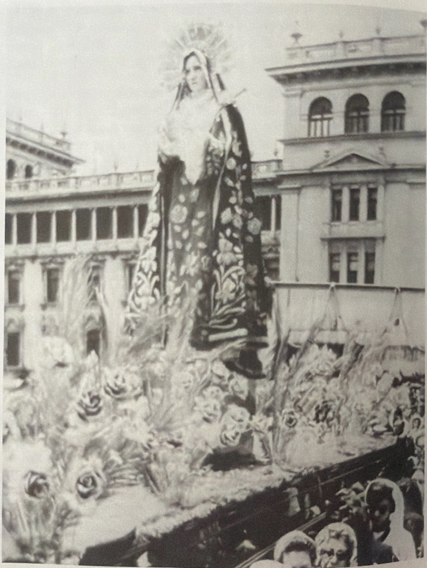
VIERNES SANTO, 31 DE MARZO DE 1961