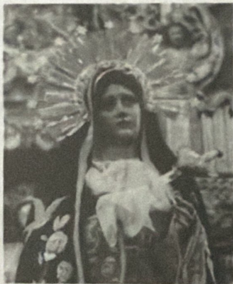
SANTISIMA VIRGEN DE DOLORES DE LA MERCED