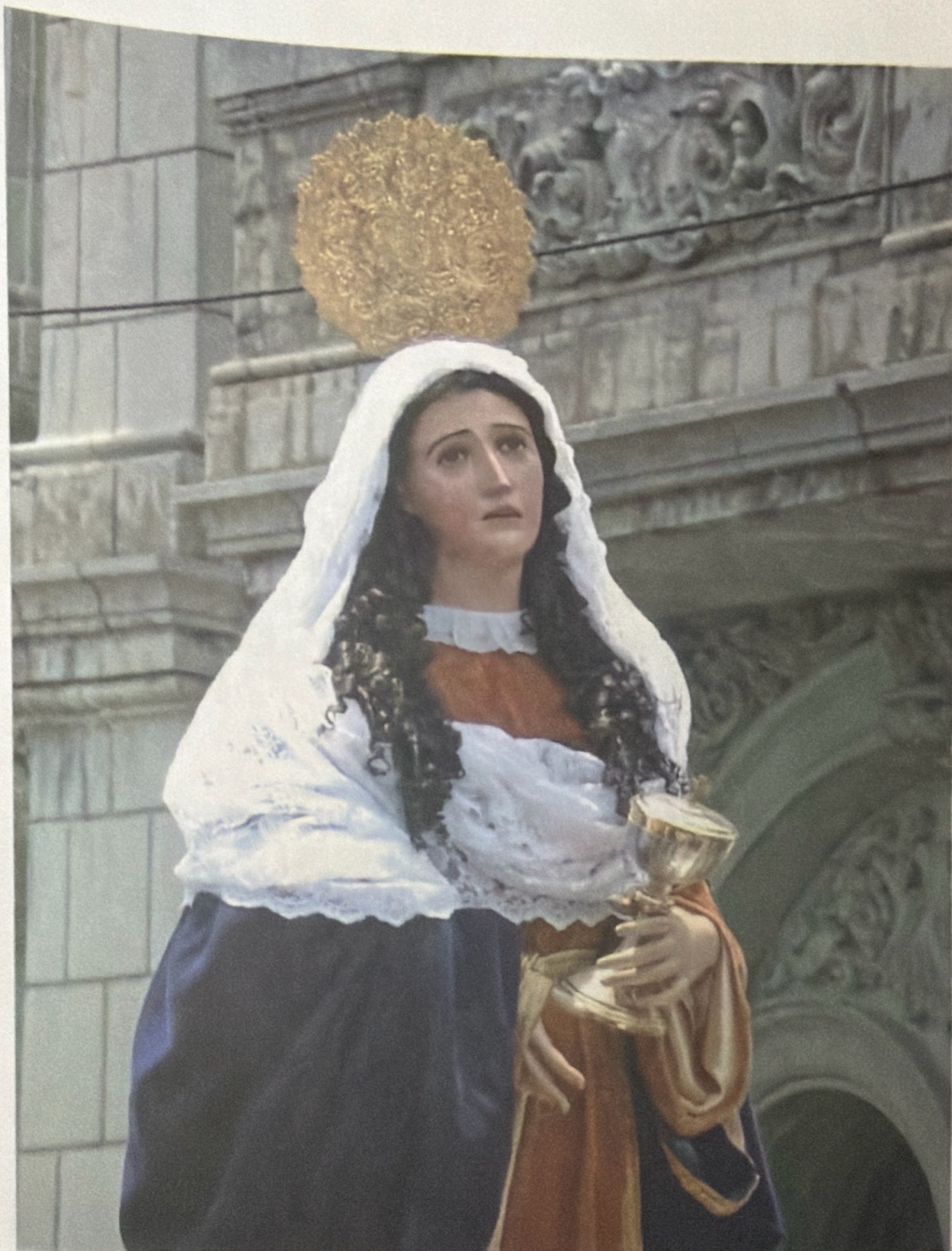
SANTA MARIA MAGDALENA IMAGEN COLONIAL CON VARIADAS INTERVENCIONES QUE ACOMPAÑA LAS PROCESIONES DE JESUS DE LA MERCED