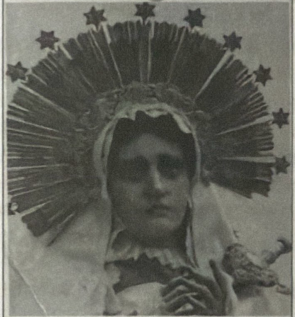
SMA. VIRGEN DE DOLORES LA MERCED