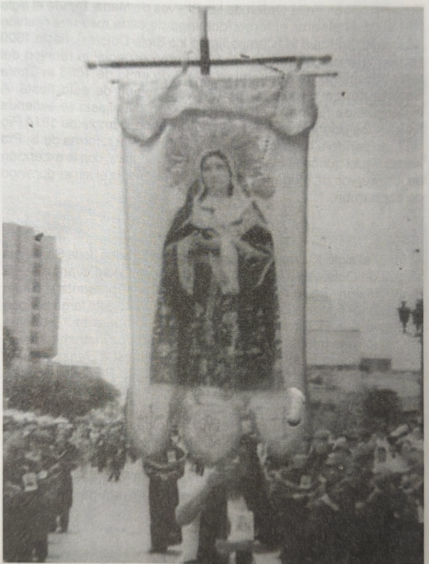
ESTANDARTE VIRGEN DE DOLORES, PINTADO POR MARTÍNEZ DIGHERO, LAMENTABLE PERDIDA EN INCENDIO DE 1986.