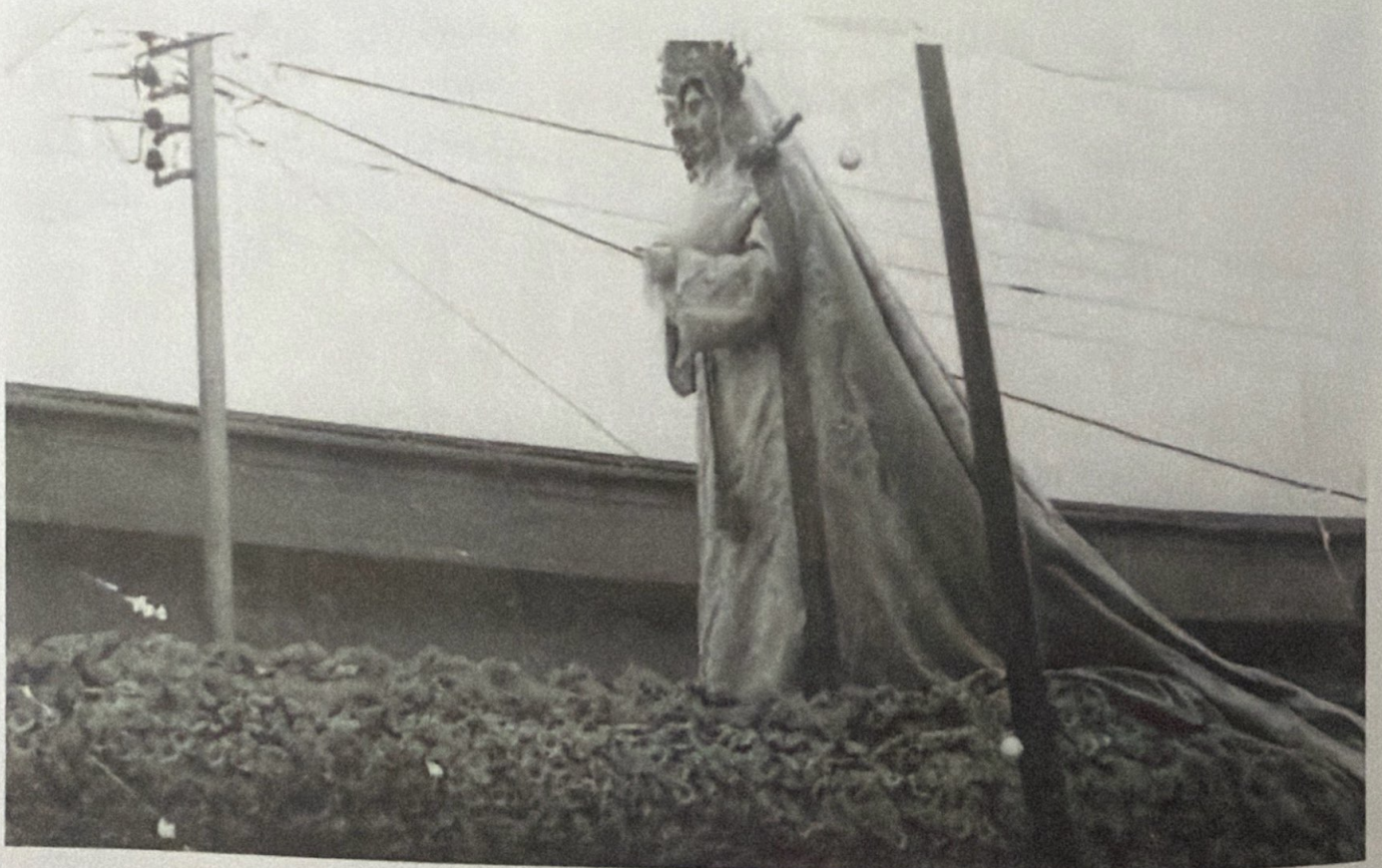
VIERNES SANTO, 1969