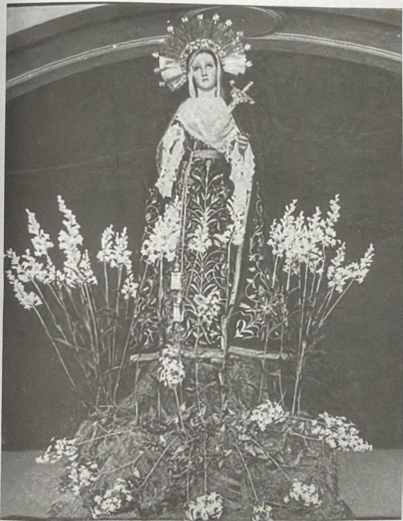
VIERNES SANTO, 11 DE ABRIL DE 1941