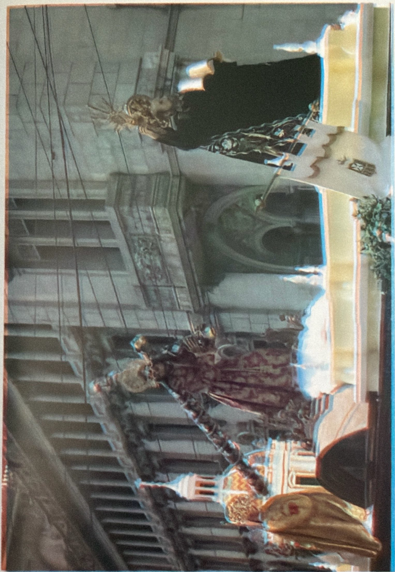
VIERNES SANTO, 6 DE ABRIL DE 2012