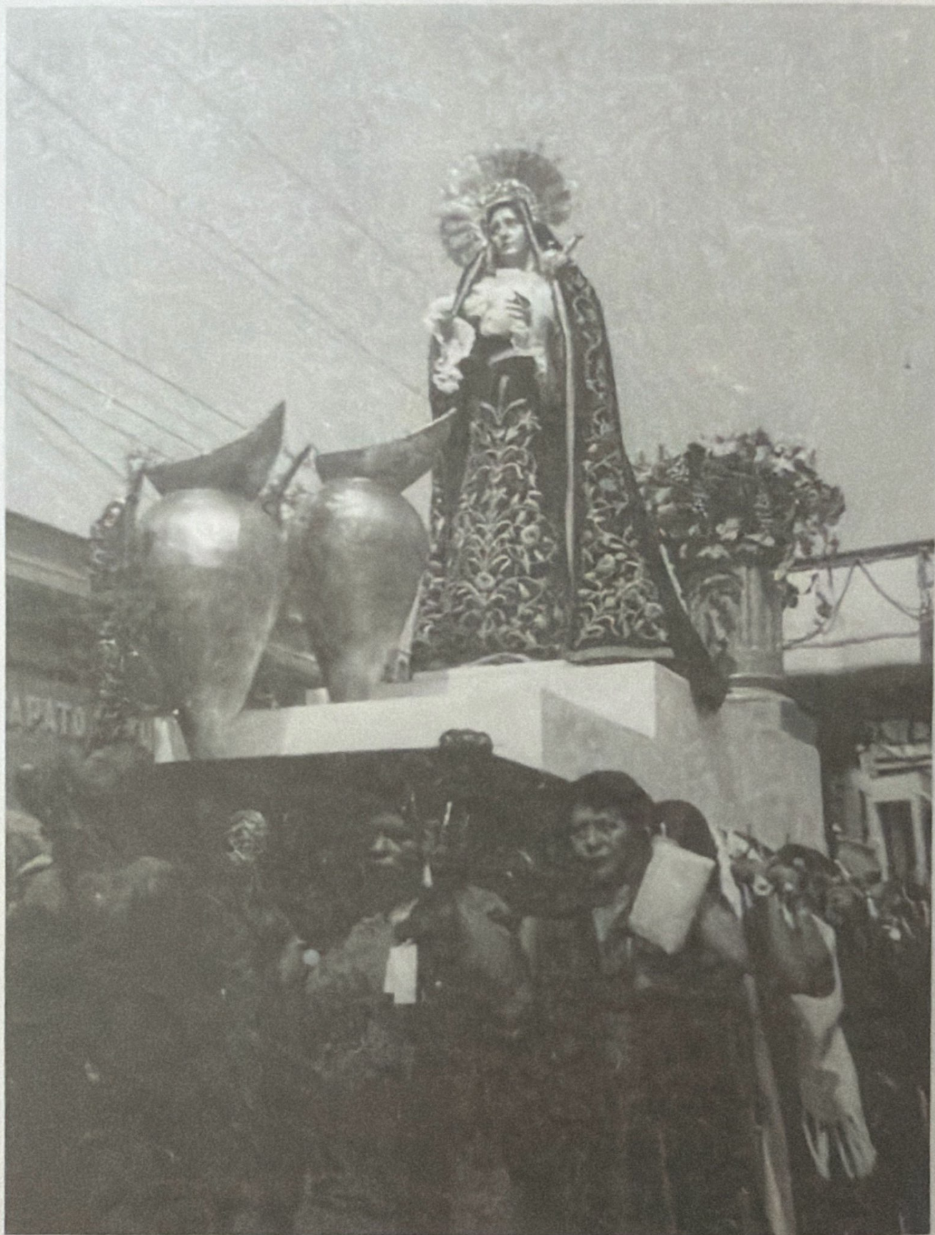
VIERNES SANTO, 8 DE ABRIL DE 1955