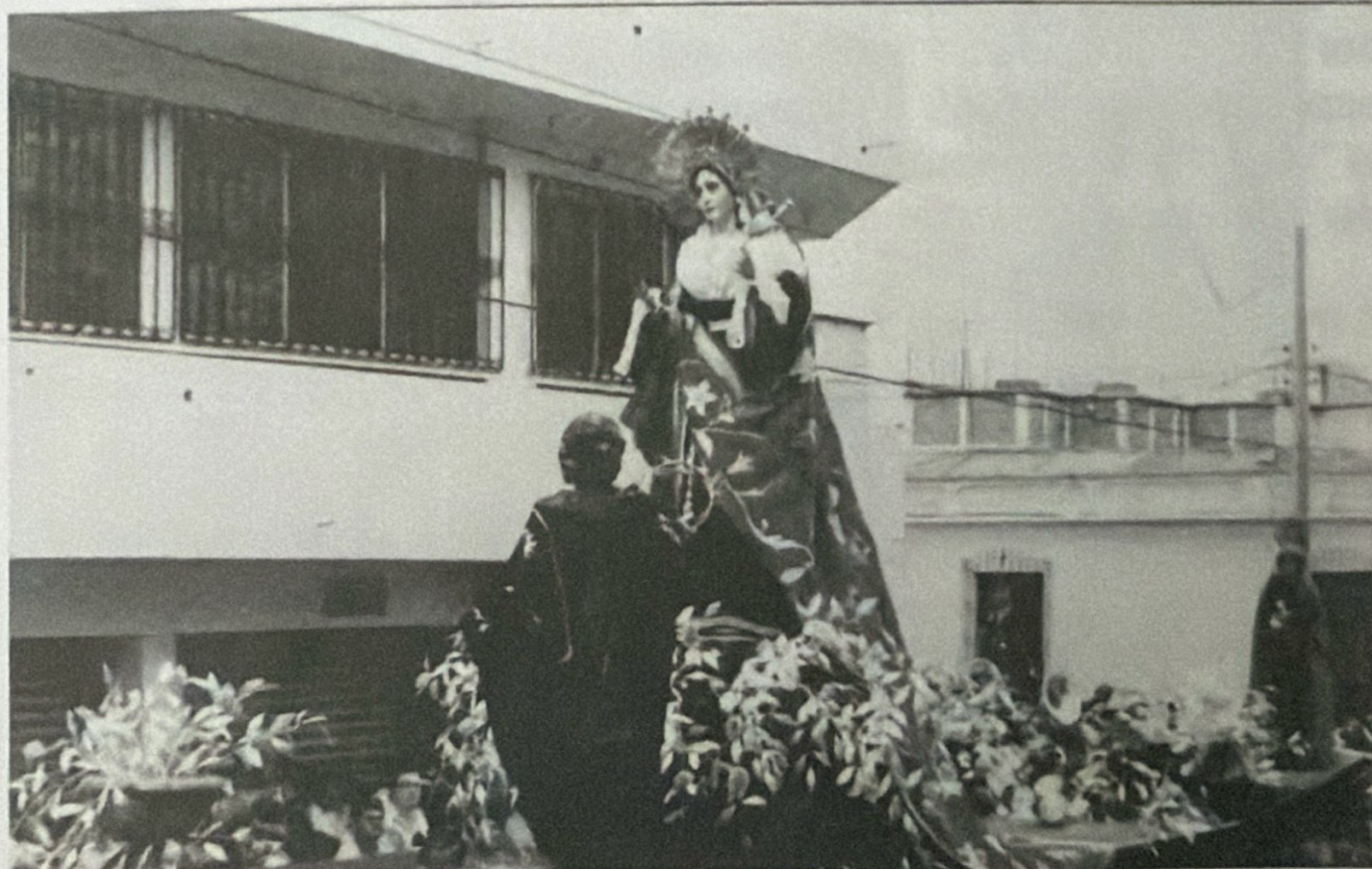
VIERNES SANTO, 4 DE ABRIL DE 1996