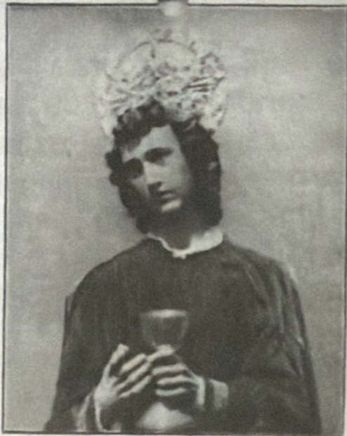
San Juan, de la Iglesia de La Merced