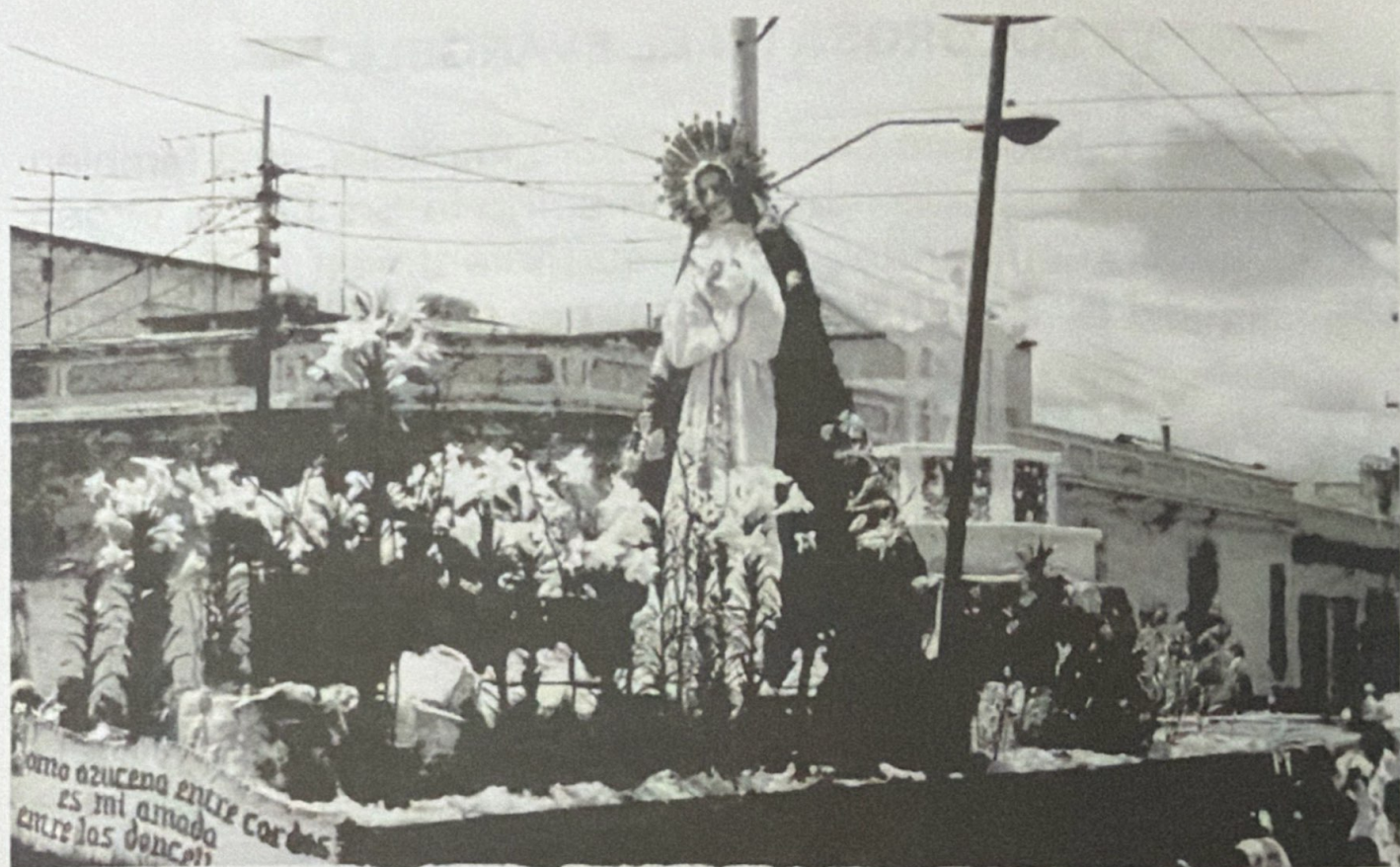
VIERNES SANTO, 1990