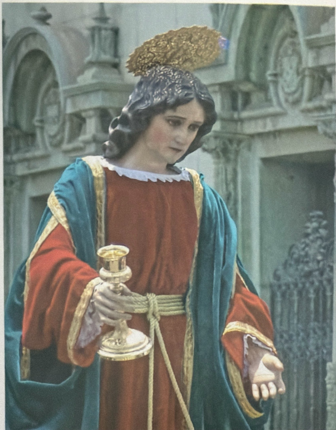
NUEVA IMAGEN DE SAN JUAN EVANGELISTA A PARTIR DE 1987, PARA LA SOLEMNE PROCESIÓN DE VIERNES SANTO. OBRA DEL INSIGNE ESCULTOR HUBERTO SOLIS DE MEDIADOS DEL SIGLO XX.