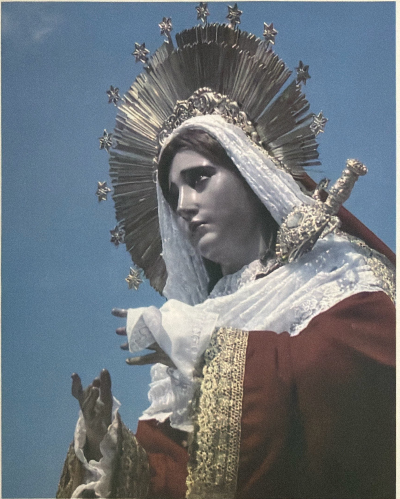
SANTISIMA VIRGEN DE DOLORES DE LA MERCED "NUESTRA SEÑORA DE LA ESCLAVITUD" ACOMPAÑA A JESÚS DE LA MERCED EN SUS PROCESIONES A PARTIR DE 1918.