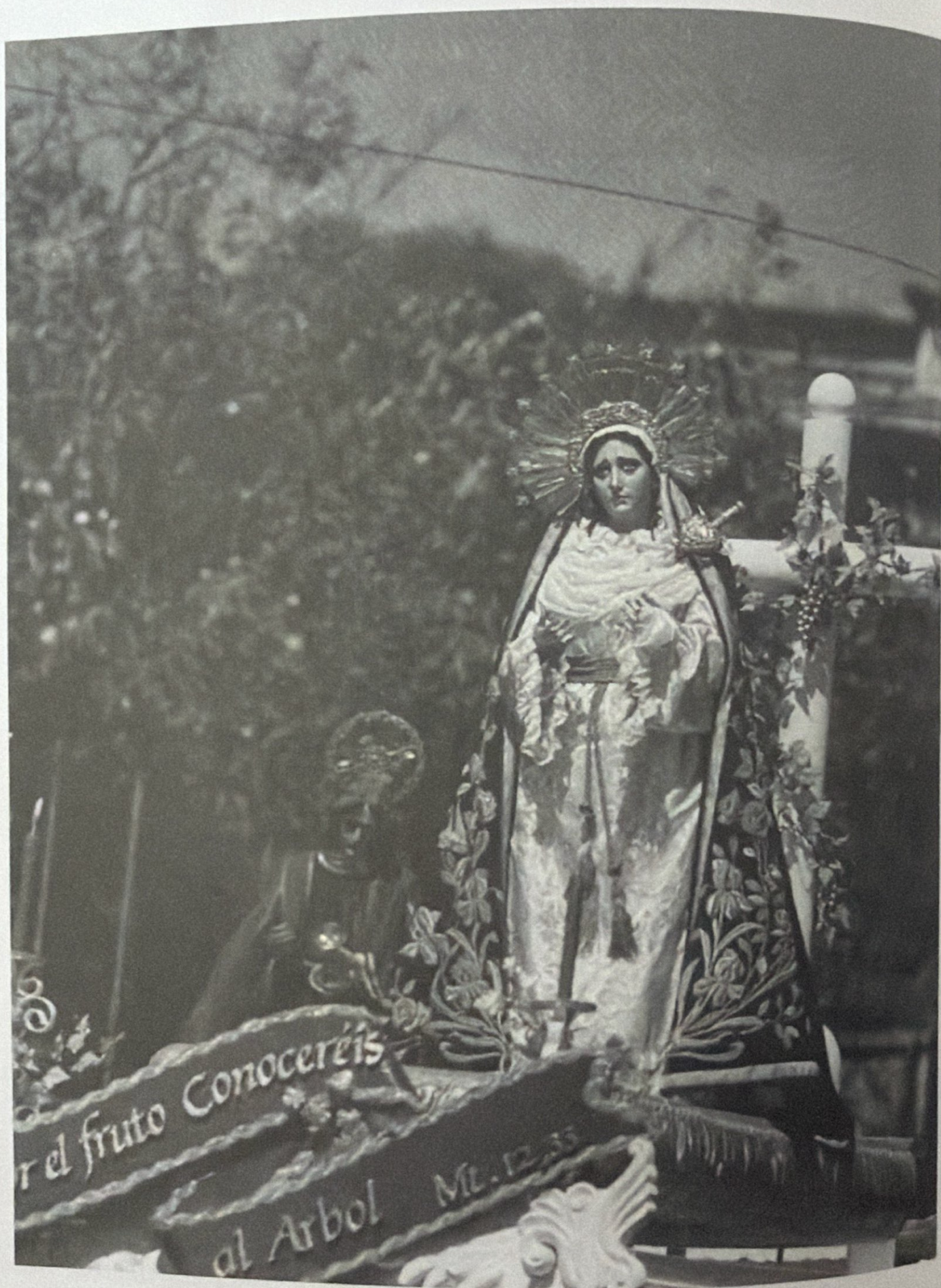
VIERNES SANTO, 5 DE ABRIL DE 1997