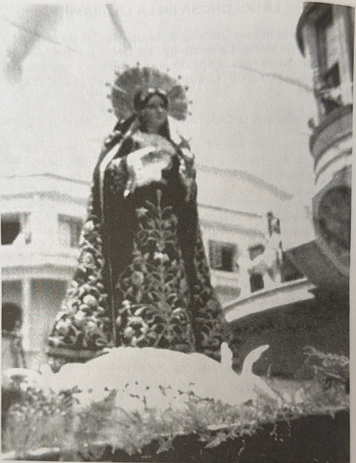
VIERNES SANTO, 30 DE MARZO DE 1956