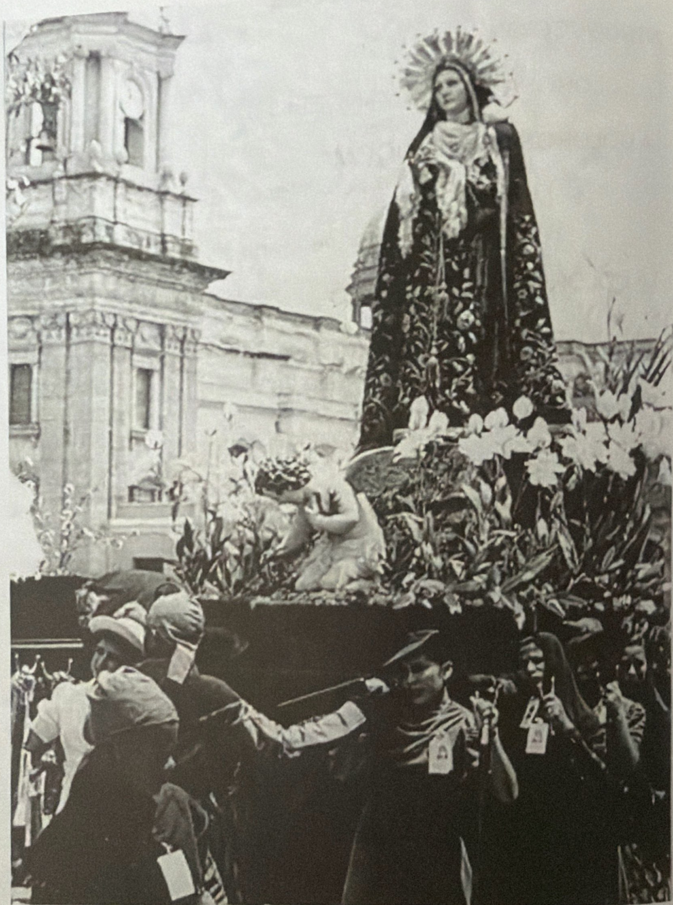
VIERNES SANTO, 23 DE MARZO 1951