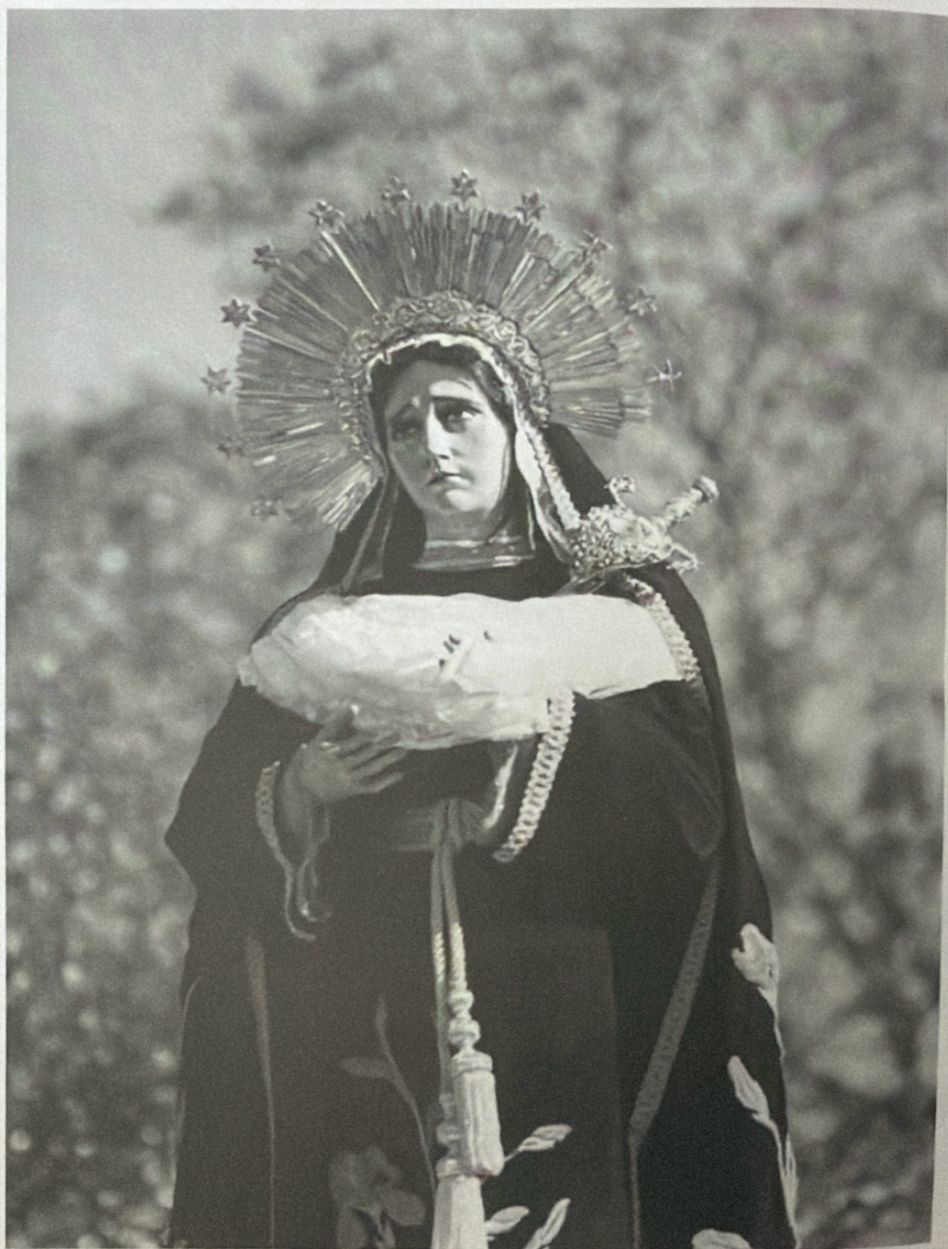
VIERNES SANTO, MARZO 2002