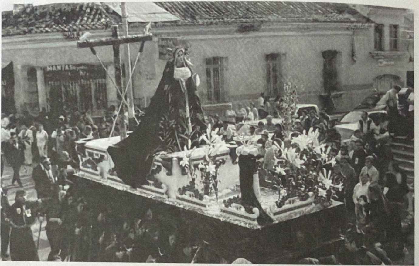
VIERNES SANTO, 21 DE ABRIL DE 2000