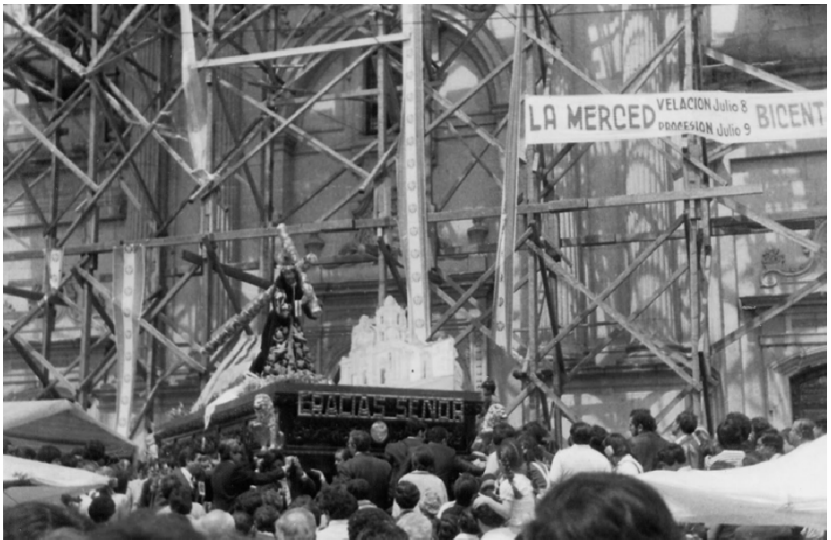
Salida de la procesión del Bicentenario de Traslación, Domingo 9 de julio de 1978.