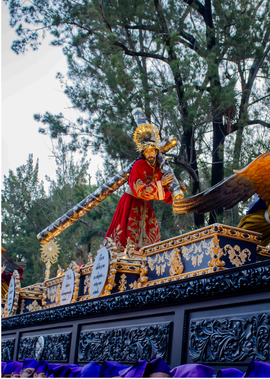
Solemne y tradicional procesión de Viernes Santo 2024.