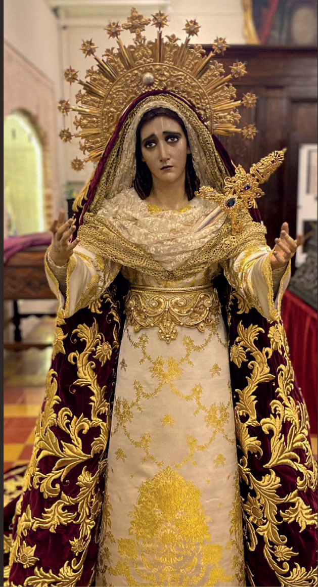
Consagrada Imagen de la Santísima Virgen de Dolores