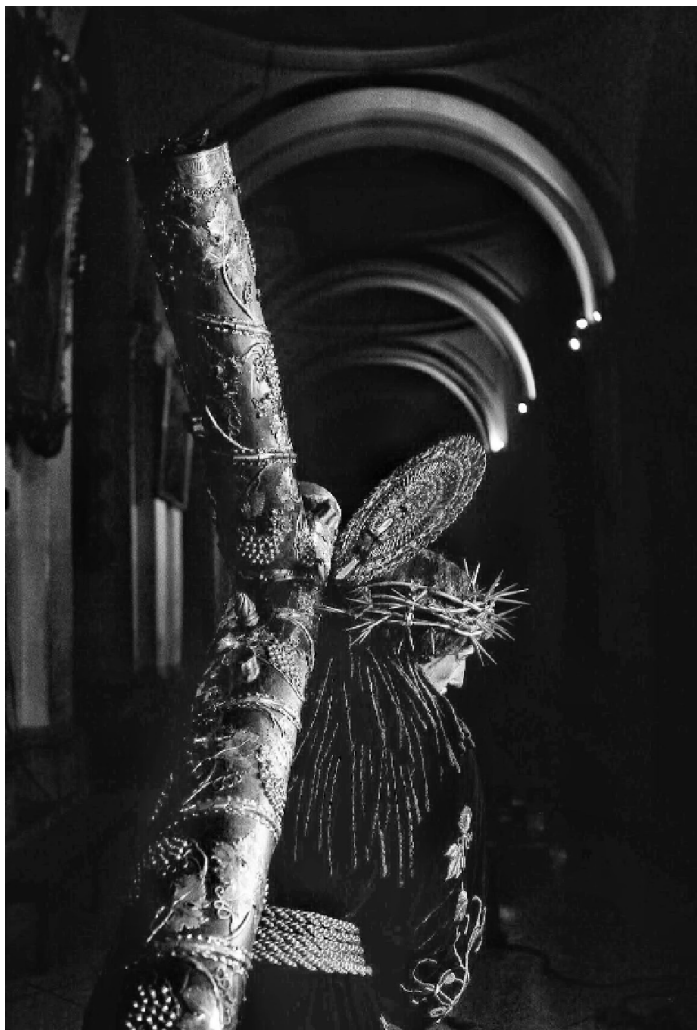
■ Jesús ubicado en la nave norte del templo. Sesión de fotos julio 2018.