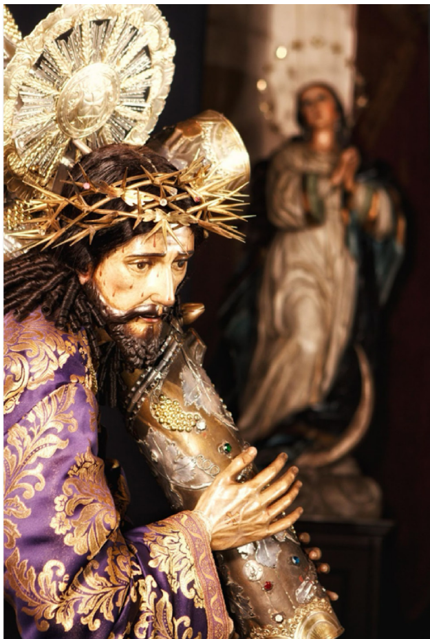
Julio 2018, inusual fotografía de la sesión de fotos para el libro Joyas del Nazareno.